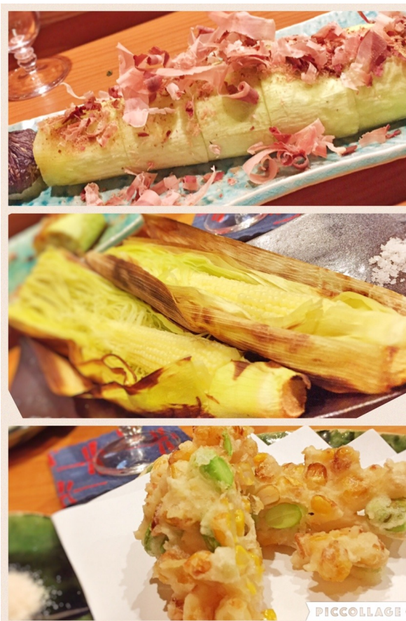
特筆すべくはやはり野菜メニュー。熊本の赤茄子焼き、ヤングコーン焼き、とうもろこしと枝豆のかき揚げなど、焼きもの、揚げ物も絶品でしたが