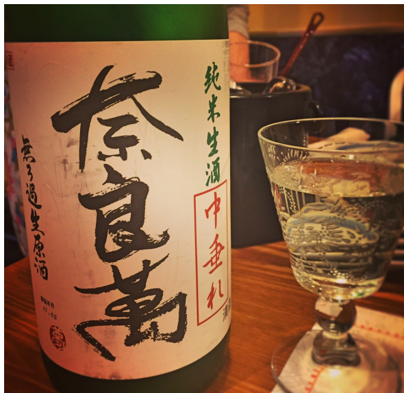
乾杯はシュワシュワの奈良萬 純米生酒 中垂れ。旨味たっぷりだけど爽やかで瑞々しくフルーティーでたまらなくフレッシュ！幸せ。