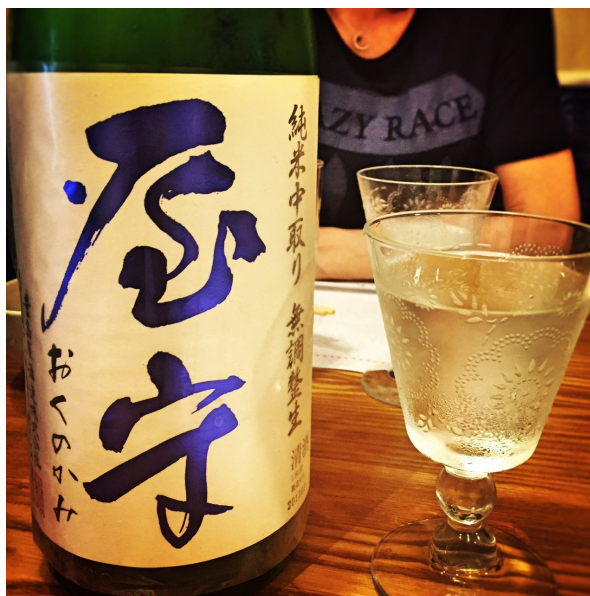
久しぶりに飲んだ大好きな屋守 純米中取り。キレがありジューシーで、あふれんばかりの旨味。やっぱり好きだわ♪