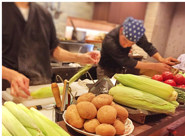
日本酒にこだわっている和食屋さんですが、野菜にもこだわっていて、オープンキッチンのカウンターの上にはつややかなフレッシュ野菜がズラリ！