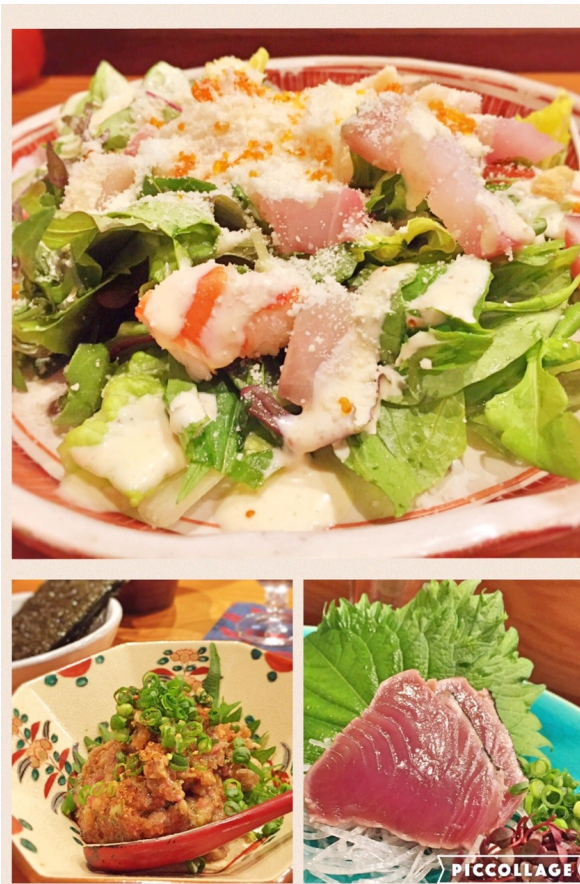
海鮮たっぷりの一穂サラダに名物鰹のわら焼き、梅風味が爽やかな鰹のなめろうなど、魚介も美味しく。