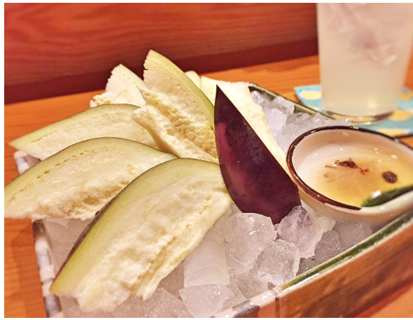
塩と胡麻油でいただく、水茄子のお刺身のみずみずしさときたら！