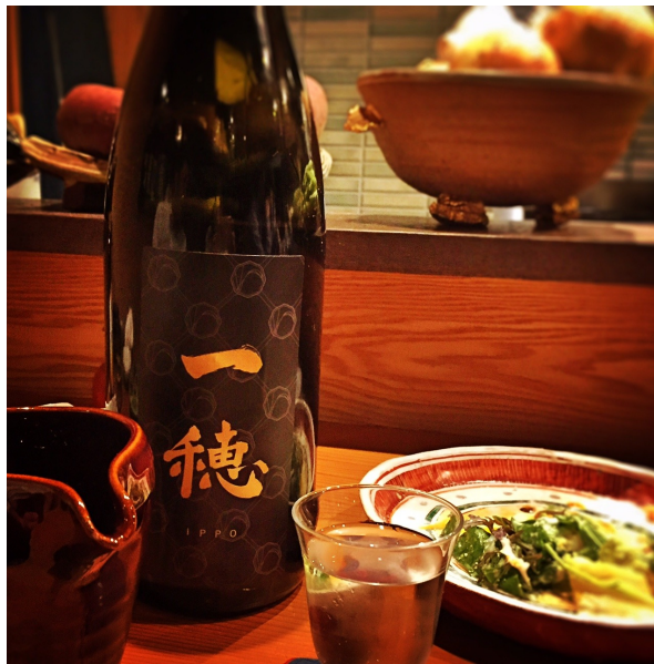
こちらのお店オリジナルの純米吟醸は、旨口だけど、甘過ぎずスッキリ。食中にちょうどよいお味でした！