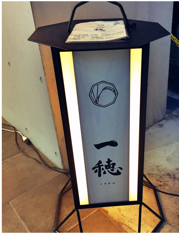
三茶の一穂さんは、分かりにくいオフィスビルの上の隠れ家。